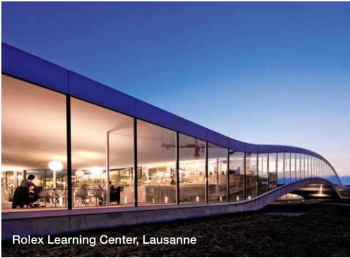
Rolex Learning Center, Lausanne