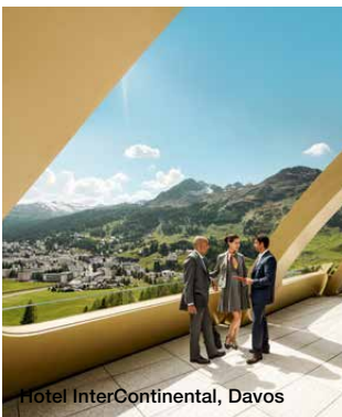
Hotel InterContinental, Davos