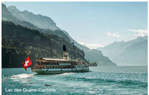
Lac des Quatre Cantons