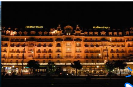
ORTS EINHEIT /NÄHE