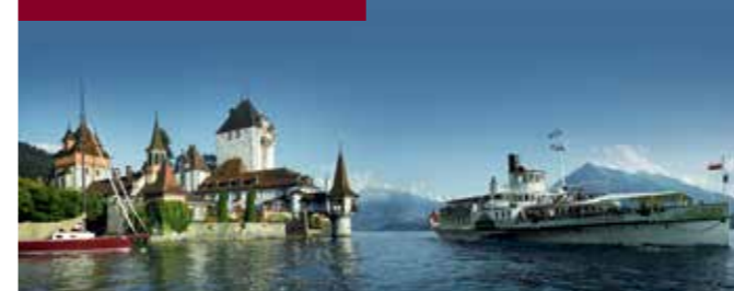
Lake Thun or Lake Biel

Weit oben stehen majestätische Gipfel und Schneeberge Spalier, von den Ufern grüssen historische Schlösser und rings um Sie und Ihre Gäste erstreckt sich der See. Die Motorschiffe bieten ausreichend Platz für eindrucksvolle Veranstaltungen. ► Schiffe bis 700 Personen