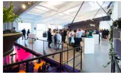
RBS S7 (Papiermühle) 120 📺 | 📅 | 📄 | WLAN