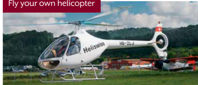
Fly your own helicopter

Ein Bubentraum geht in Erfüllung! Realisieren Sie sich den Traum vom Fliegen! Steigen Sie ein ins Helikopter-Cockpit und greifen Sie mit der Unterstützung eines erfahrenen Piloten selbst zum Steuerknüppel. ▶ Bis 20 Personen