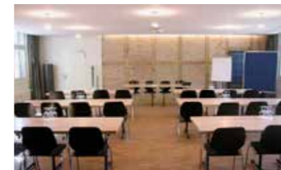
Bus 12 (Bärengaben)