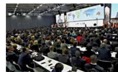
Tram 9 (Guisanplatz)