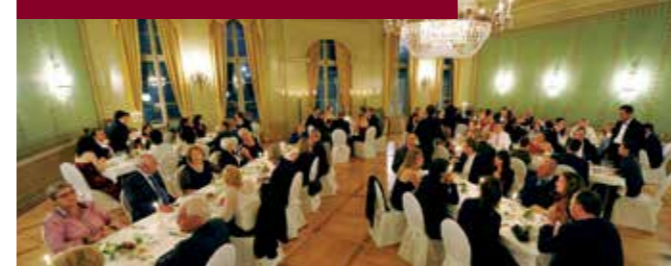
Restaurant Zum Äusseren Stand

Ein Haus, drei Lokale, viele Möglichkeiten: Der Äussere Stand steht für Qualität, Individualität und Kontinuität. Als Ort der Entstehung der heutigen Schweiz (ehemaliger Ständeratssaal) wurde hier Geschichte geschrieben und wird die Zukunft neue Geschichten schreiben. ► Gala-Bankett bis 120 Personen | Apéro bis 200 Personen