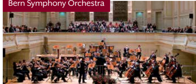
Bern Symphony Orchestra

Whether it is a sophisticated program for your successful sales force or an unforgettable reward travel, we draw on our travel planner instincts and detailed knowledge of destinations to help find the right idea for your trip. Here is an attractive sampling: