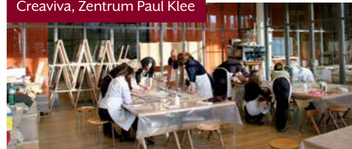
Creaviva, Zentrum Paul Klee

In Teams entwickeln Sie auf kreative Art und Weise Perspektiven für Ihr Unternehmen oder gestalten individuelle Kunstwerke, welche man durchaus auch zu Hause an die Wand hängen kann. ▶ Bis 150 Personen