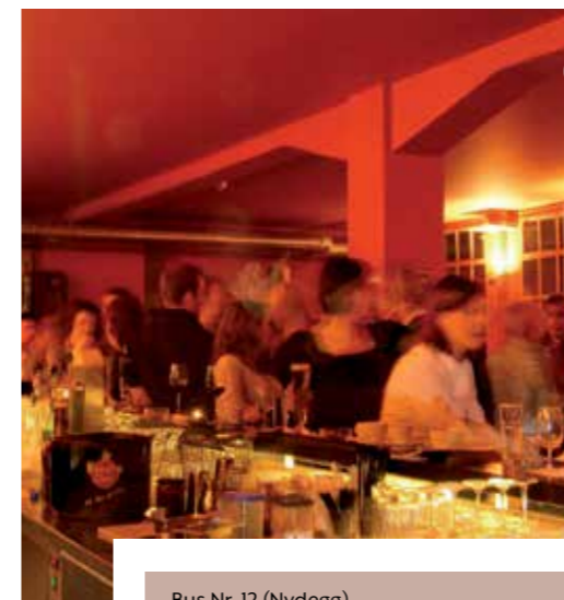
Beim Bahnhof (next to the Main Station) 📺 | WLAN