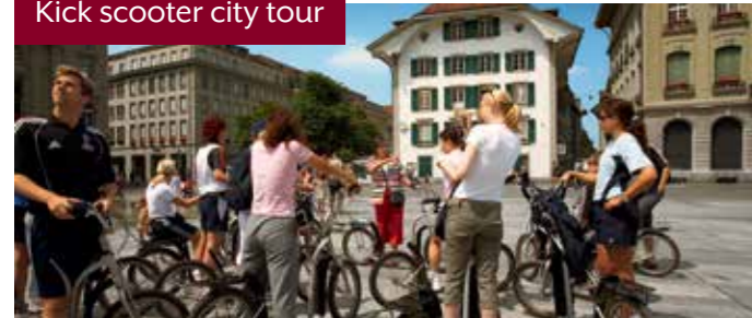
Kick scooter city tour

Ohne körperliche Anstrengung bringt die Marzilbahn Sie von der Matte aus in die obere Altstadt, wo der Spass erst richtig beginnt. Bequem und bergab kurven Sie durch die historischen Gassen. ▶ Bis 80 Personen