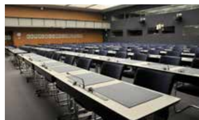
Tram 8 (Weltpostverein) 12 📺 | 5 📅 | 📄 | WLAN