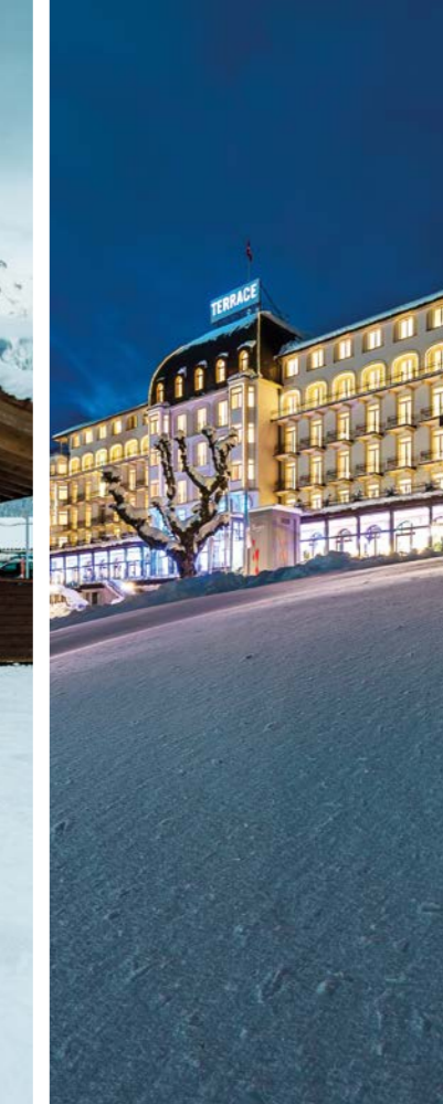
HOTEL TERRACE 5 1050 Meter über Meer m.a.s.l.

Engelberg Dorf Engelberg village TITLIS Talstation TITLIS base station