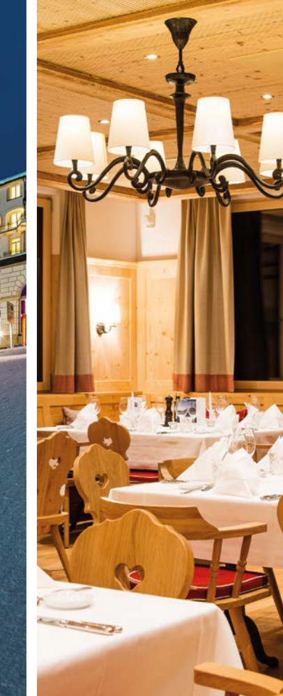
GOLF STUBLI 6 1050 Meter über Meer m.a.s.l.

Engelberg Dorf Engelberg village Golfplatz Golf course