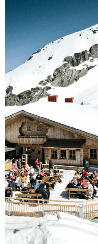
SKIHÜTTE STAND 2 2428 Meter über Meer m.a.s.l.

TITLIS Bergstation TITLIS mountain station