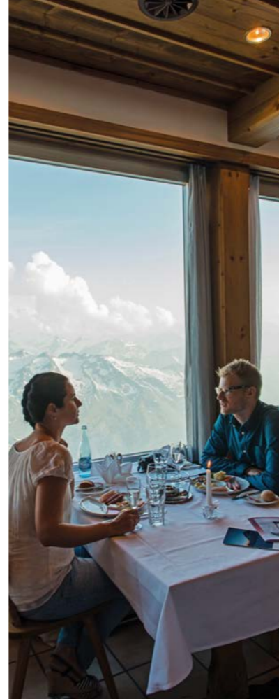
TITLIS PANORAMA-RESTAURANT 1 3020 Meter über Meer m.a.s.l.

As a cableway, hotel and catering enterprise, we have all the necessary facilities to cater for all kinds of corporate and group events – both up on Mount TITLIS and down in the valley. We have a room for every occasion, including corporate events, meetings, conferences and events. We will also be happy to organise the entire supporting programme.