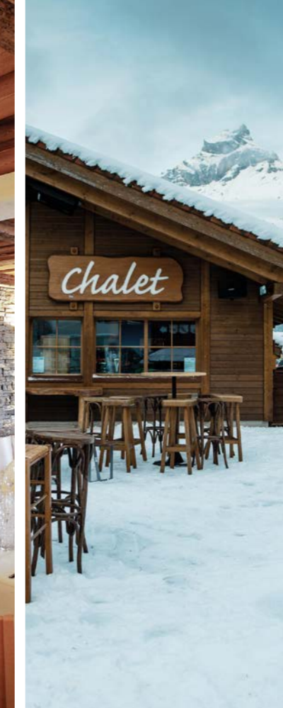
CHALET 4 1050 Meter über Meer m.a.s.l.

TITLIS Gebiet TITLIS area Bergstation Trübsee Trübsee station