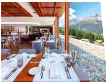
Hôtel Nira Alpina

Réputée comme station huppée, Saint-Moritz compte plus de 7 hôtels de luxe. Parmi eux se trouvent l'historique Kulm Hotel (1864) qui dispose de 164 chambres, et le Grand Hôtel des Bains Kempinski, qui rénovera bientôt ses 184 chambres. Les deux possèdent de grandes salles de réunion. Mais il y a également des adresses plus récentes et accessibles, comme le Nira Alpina qui offre chaleur et épure dans ses 70 chambres 4 étoiles. Bien adapté aux groupes, il compte une salle de réunion (60 places) et un spa donnant sur la montagne. Plusieurs nouveautés arrivent aussi. Un boutique hôtel raffiné a ouvert en août près de la gare, le Grace La Margna (74 chambres). Du côté de Pontresina, non loin, deux ouvertures se profilent. Celle du Maistra160, qui proposera 36 chambres 4 étoiles, 10 appartements et un petit espace de réunion dès novembre, puis celle du Sunstar Hotel Pontresina, qui a transformé l'ancien hôtel La Collina. Il ouvrira en décembre avec 25 chambres et 21 lofts. Les tarifs sont globalement ceux des hôtels de même niveau en France.